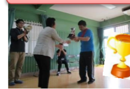
優勝トロフィー授与